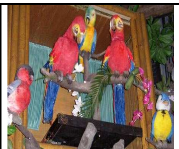
Elektroninis paukščių teatras

Ir dar daug daug visko gražaus ir smagaus yra Heidės parke. Reikia nuvažiuoti, pačiam pamatyti ir išgyventi. Reikia nuvažiuoti, būtinai reikia. Ir taškas.